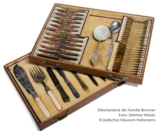
Silberbesteck der Familie Brunner