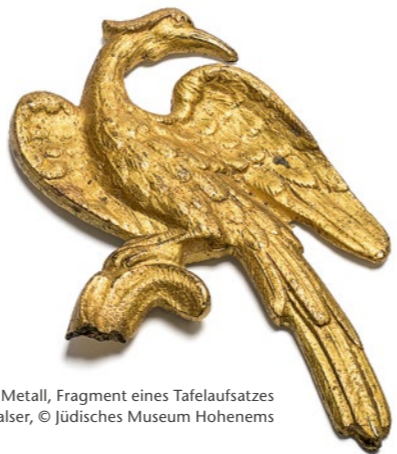
Goldfarbener Vogel aus Metall, Fragment eines Tafelaufsatzes

English speaking tours on request Contact: Gerlinde Fritz, office@jm-hohenems.at Opening Hours Museum and Café Tue through Sun 10am—5pm and on holidays