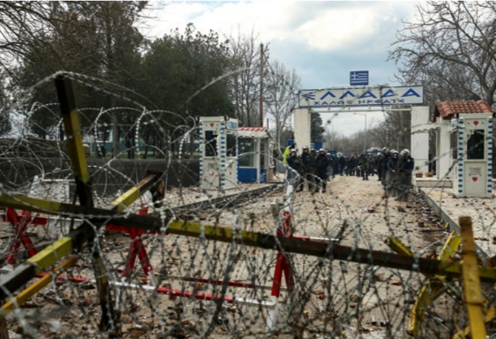
Griechische Polizei bewacht die türkisch-griechische Grenze