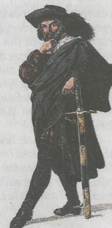
Hans Kohlhaase (1500–1540) Ein Kupferstich von um 1840, aus dem evangelischen Predigerseminar in der Lutherstadt Wittenberg