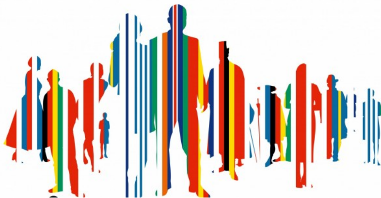
Ausstellung: "Die ersten Europäer" vom 25. März bis 5. Oktober 2014.

Die ersten Europäer. Habsburger und andere Juden – eine Welt vor 1914. Eine Ausstellung des Jüdischen Museums Hohenems: 25. März bis 5. Oktober 2014. Eröffnung: 23. März 2014, 11.00 Uhr, Salomon Sulzer Saal