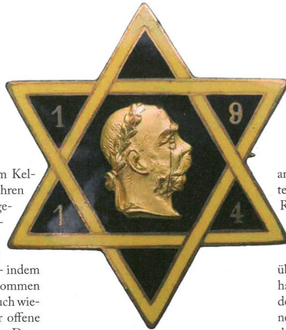
Aus der aktuellen Ausstellung Die ersten Europäer . Abzeichen aus dem Ersten Weltkrieg, Österreich-Ungarn, 1914.